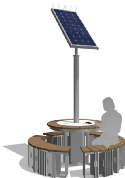
ワイヤレス充電スポット 50W 出力×3か所