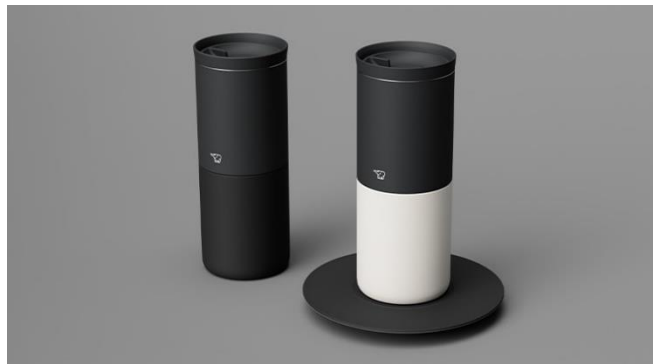
HOME & MUG

ご不明な点がございましたら下記問い合わせ先までWebまたはEmailにてご連絡下さい。